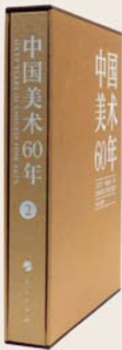
图 46 &gt; 《中国美术 60 年》侧视图

如：水墨画、布面油画、木版套色、综合版套色、铜板套色、石版套色、石雕、木雕、玻璃钢、陶、铸铜着色、焊铁、玻璃钢着色、漆画、年画等，以宏大的场景突出表现了极为丰富的艺术形式和多样性，展示了博广而宏深的艺术风格，全方位拓宽我们的审美视野，充分体现人类对造型艺术的创作激情和对美好生活追求。