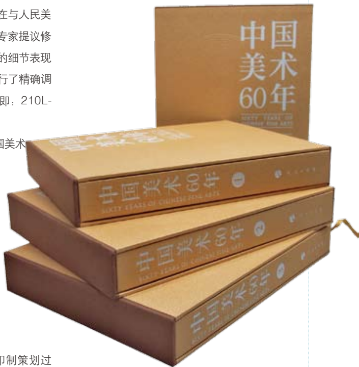
图 47>《中国美术 60 年》全套

制流程的命脉所在, 又是传统印刷实现美术作品复制再现的核心工程, 也是完成这部重要著作的根本保证, 假设, 如果没有艺术复制经验、没有成熟的色彩管理基础、没有各个环节对应的标准数据, 只凭普通经验和有限技术来完成这样一部多达36项造型题材的美术史汇编, 是难以想象的事情。这次全程工作的重要实践, 在提升我们审美意识的同时, 积累了丰富的艺术作品与印制工艺对应的色彩管理数据。对于这部著作印制过程的所有参与者来说, 如同历经了中国美术史的创作发展历程, 从中切身体验了中国美术六十年的辉煌与荣耀, 鉴赏了造型艺术的美所带给生活丰富多彩多姿的绚烂图景, 再一次提升了我们艺术审美境界的广阔视野, 这对于所有参与这部著作印制策划的亲历者都将是莫大的荣幸!