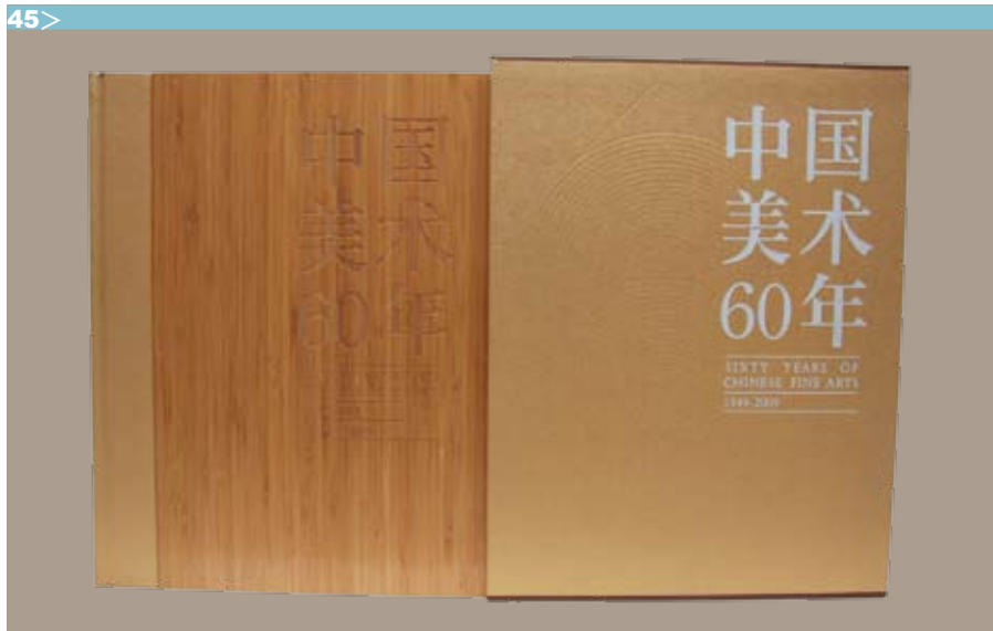
图 45-《中国美术 60 年》正面图

艺术品（造型艺术）的复制印刷，是一项严谨的专业色彩管理实施过程。雅昌企业集团在这项专业领域历经了十六个春秋的追寻与探索，成就了当代艺术复制的全面色彩基础管理工程。这个工程首先起航于雅昌集团董事长万捷先生对当代印刷企业的科学管理思路。雅昌企业集团建立以来的发展历程，一直秉承万为人民艺术服务的宗旨。《中国美术六十年》的成功经验，正是这种科学理念在雅昌企业的又一重要实践。在我国综合艺术领域见证了雅昌企业文化产品迈向艺术为人民服务高端市场的广阔前景，在当代中国美术史上，创造了中国印刷领域辉煌的印艺诗篇。在一个印前与印后工艺体系完美结合的当代印刷企业，具备印制工艺全过程的色彩管理基础设施，是非常必要的。今天，之所以能够顺利完成这项历史巨著的印制，是雅昌企业集团成长过程与企业科学管理发展史上的必然。