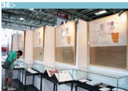
图 34> 参观人群驻足雅昌展馆欣赏精美艺术书籍