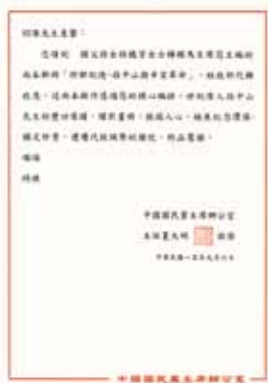
图4&gt; 孙中山孙女孙穗芳博士为此书作者题字