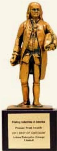
图1> 班尼金奖“小金人”