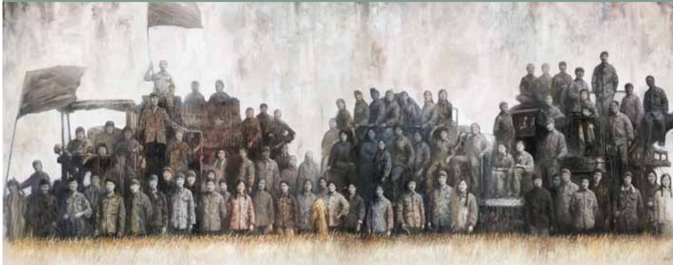
图3&gt; 麦收 水壶 镰刀