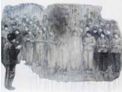
图1&gt; 天天读毛主席语录