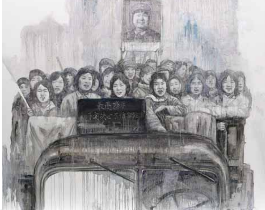
图2&gt; 出工 主席像

赵大陆，1953年生于北京，1982年毕业于北京电影学院美术系，曾在首都师范大学美术系任教授，中国美术家协会会员。1979年作为“星星画会”的主要成员，作品“鱼妖”等参加了在北京举办的首届“星星画展”。作品曾参加过北京国际艺苑第三届美展、中国美协新人新作展、在新加坡举办的第一、第二届中国当代艺术家油画展等国内外画展。1989年由文化艺术出版社出版《赵大陆油画人体选》，1992年由人民美术出版社出版《赵大陆油画作品集》，1997年由岭南美术出版社出版《赵大陆油画作品》等三本个人绘画专集。1990、1991、1993及2000年应邀赴意大利罗马成功举办四次个人油画展。两次应邀参加罗马国际文化团结学院的国际学院艺术沙龙年展，作品两次获