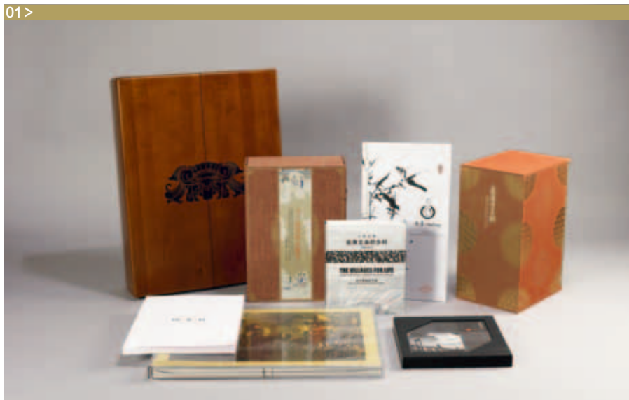
图1&gt; 雅昌集团2012年班尼金奖获奖书籍

当大师们的经典作品邂逅恰如其分的装帧设计，不但能将其内容恰当地表现出来，完美展现出书籍的灵魂；在视觉上也有了无限可能，让作品散发出秀外慧中的艺术气质，成为“形神兼备”的艺术品。