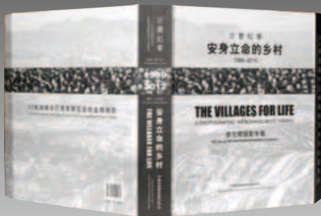
图3&gt; 《安身立命的乡村》