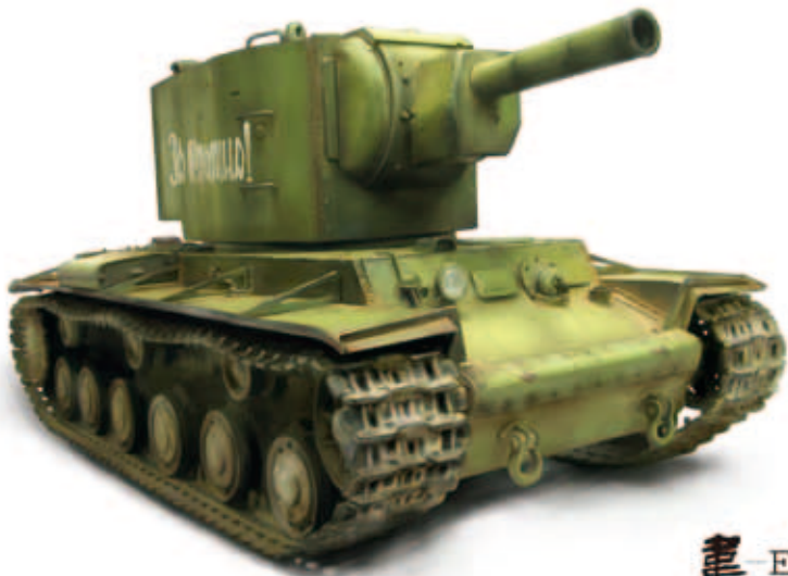
图1> 电脑绘图 坦克

在雅昌一路走来，我不仅在专业上有所提升，最重要的是受到了艺术熏陶工作中每天都与名家的艺术品打交道，不知不觉已接触到无数名作，从对画面的认识，到画面内涵的理解，逐渐让我对艺术有了更深理解。正因为雅昌有这浓厚的艺术气氛，我在耳濡目染中自觉的去提升文化和艺术修养，业余时间去练习绘画或书法等，这样的氛围让我感觉到这不仅仅是一个公司，更是一个“艺术家”聚集的地方。就是在大家的关心、帮助下，我渐渐变得成熟，以后的日子，我会一如既往的努力工作，尽自己的能力为公司做有意义的事。