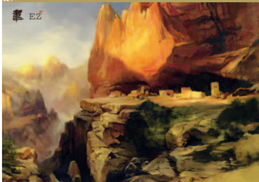
图2> 电脑绘图 大师名画临摹