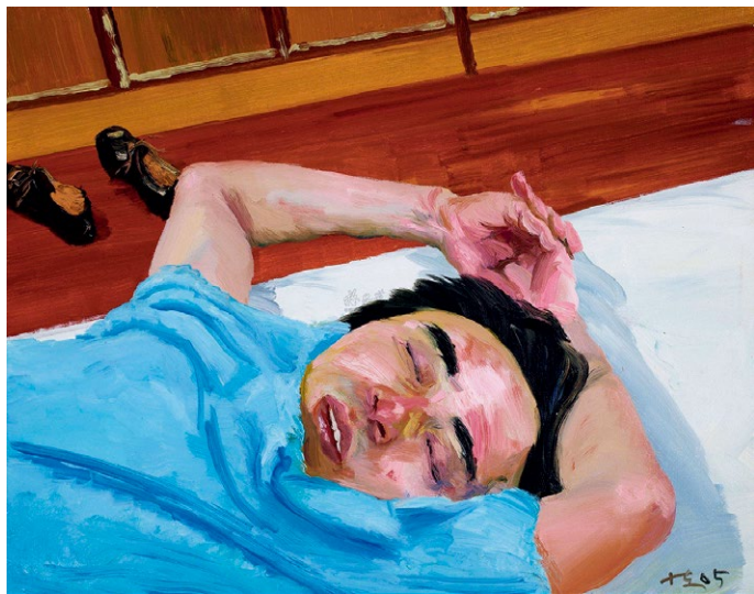
儿时的朋友都胖了 2005年作

在全力排挤外部世界的希望空间，也在排挤外部世界的意义的对绘画的注入，排挤任何的诗意想像对绘画的浪漫入侵。超越性被挡在画框之外了。正是在这个意义上，一种新的绘域语言出现了：绘画在封闭绘画自身的疆界。在绘画的疆界内不是没有意义，而是没有外来的意义。这个疆界不是剔除了意义的疆界，而是剔除了超越性意义的疆界，剔除了抒情性的疆界——抒情性被剔除得干干净净。在二十世纪的中国，绘画，由于它被动荡的历史所折磨，因而也总是被动荡不安的抒情所反复地折磨。到了刘小东这里，抒情性被驰离了绘画。抒情、浪漫、反思批判和超越性被刘小东过滤了——刘小东将令人惊讶的细致和耐心奉献给了世俗性，奉献给了庸常，奉献给了无名者，奉献给了暗淡无光的生存。是的，这些画是光，但是它照亮的对象却毫无光芒。