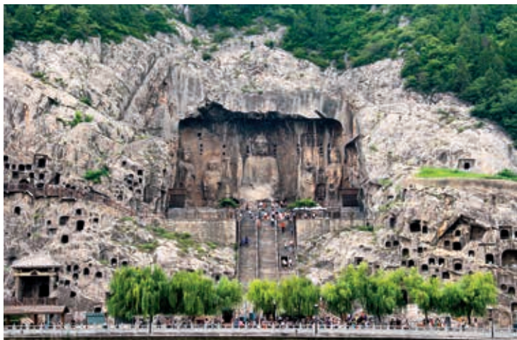
图 / 王建武 文 / 蔡文兵

昔日的宫殿 不见了昔日的笙歌宴舞 在黑暗中矗立 它依然那么光芒四射 皎洁的月光 比不上宫灯那么璀璨 却依然默默的陪伴 只为了让你不那么孤单